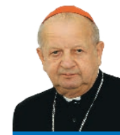
Kard. Stanisław Dziwisz Przyjaciół i osobisty wieloletni sekretarz papieża Jana Pawła II

Czy Europejczycy zdają sobie sprawę z tego, że Europa jest – według określenia papieża Franciszka – „babcią, która nie jest już płodna i nie tętni życiem” 22 , i trzeba jej na nowo otworzyć się na transcendentny wymiar życia?