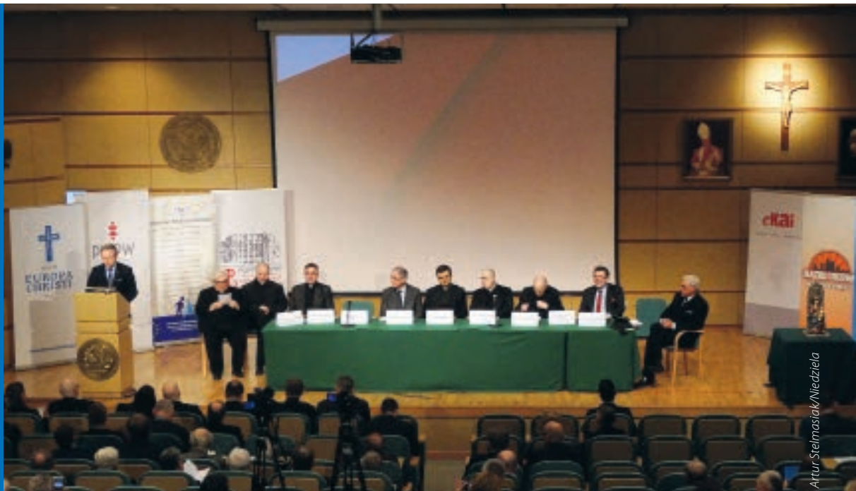
Sympozjum Ruchu „Europa Christi” na Uniwersytecie Kardynała Stefana Wyszyńskiego w Warszawie, 14 marca 2017 r.

Ruch „Europa Christi” serdecznie dziękuje Redakcji „Niedzieli” za możliwość docierania do Czytelników tego tygodnika z przesłaniem dotyczącym sytuacji, którą nazywa się dzisiaj kryzysową dla Europy. W miarę możliwości będziemy służyli cennymi tekstami znakomitych autorów, którzy mają nam wiele do powiedzenia na temat chrześcijańskich korzeni Europy.